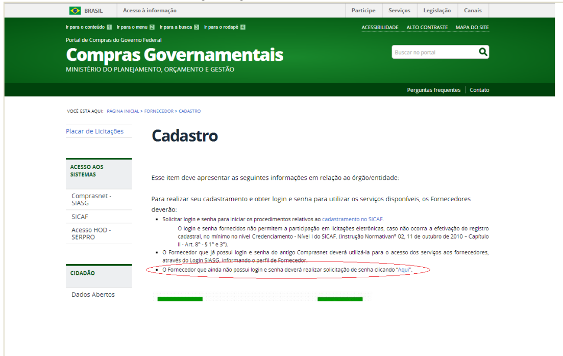
Fig. 1. Página de Cadastro de Fornecedor.

Segundo a taxonomia [18], houve um erro em relação aos requisitos de exibição da informação na descrição da mensagem apresentada. Conforme a taxonomia, as mensagens apresentadas devem ser claras e elucidativas e não devem gerar no usuário, dúvida ou sentimento de culpa por ter errado algum comando. Deste modo, no que tange à transparência, ocorreu uma falha nas características de uniformidade e operabilidade.